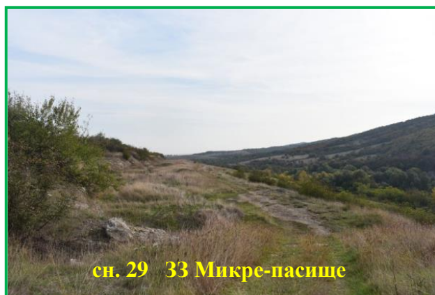
сн. 29 33 Микре-пасище