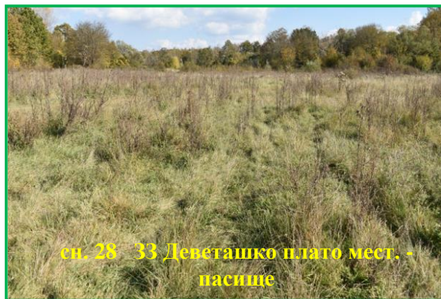
сн. 28 33 Деветашко плато мест. - пасище

- сигнал относно сеч на дървета в землището на с. Муселиево, общ. Никопол. Установено е, че сечта се извършва по Разрешително на Община Никопол за почистване на дърво и отводнителни канали, общинска собственост, попадащи в 33 BG0000247 "Никополско плато". Уведомени са СГКК – гр. Плевен за установеното