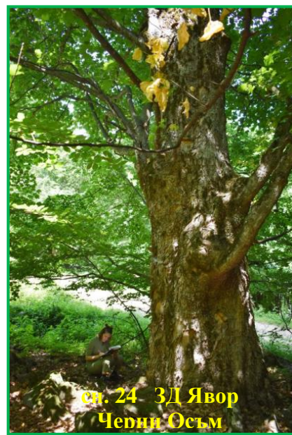
сн. 24 ЗД Явор Черни Осъм

Летен дъб, в гр. Белене, за защитени дървета. При една от проверките е установено, че дърво от вида Космат дъб в з-ще с. Писарово е отсечено, а пънят е опожарен. Направени са предписания до собственика – Областно пътно управление – гр. Плевен и до Кметство с. Писарово и Община Искър за предоставяне на информация за наличната при тях документация с отношение към сечта на дъба. Предписанията са изпълнени без да е установен извършител на нарушението. Предприети са действия за заличаването му от държавния регистър. Такива действия са предприети и за дърво от вида Обикновен бук, з-ще с. Бели Осъм, което е изсъхнало. Извършените проверки в с. Горталово са във връзка с молба от собственика на Гледичия за премахване на клони, надвиснали над покрив, и по сигнал за опасни сухи клони от Черна топола, надвиснали над екопътеката в ПЗ „Чернелка“. Преценено е, че опасните и сухите клони от двете защитени дървета могат да бъдат премахнати без влошаване физиологичното състояние на дърветата.