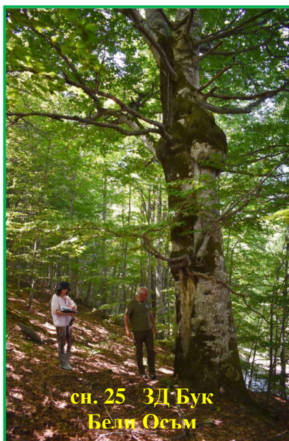
сн. 25 ЗД Бук Бели Осъм