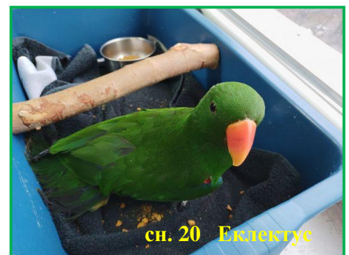
сн. 20 Еклектус