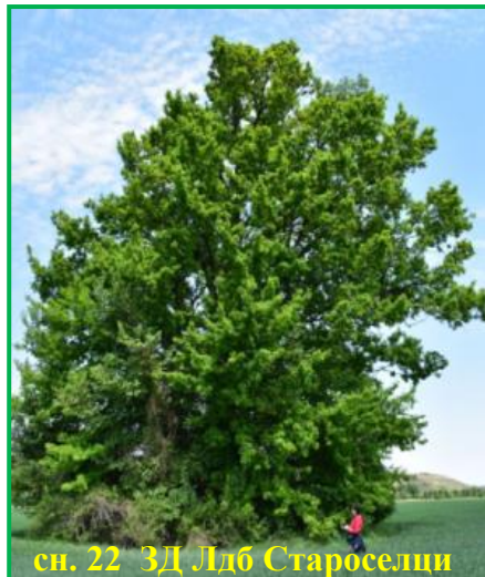
сн. 22 ЗД Лдб Староселци