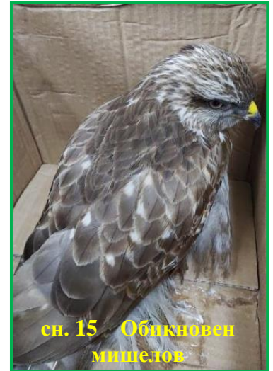
сн. 15 Обикновен мишелов

- пуснати на свобода в подходящ район - 1 екземпляр от вида Зеленика от гр. Плевен; 7 екземпляра от вида Шипоопашата костенурка (Сн. 16) (установени са във връзка с писмо от Окръжна прокуратура - гр. Плевен за отглеждане на костенурки в с. Брестовец, общ. Плевен. Съставен е акт, а костенурките са пуснати на свобода в подходящ район (Сн. 17));