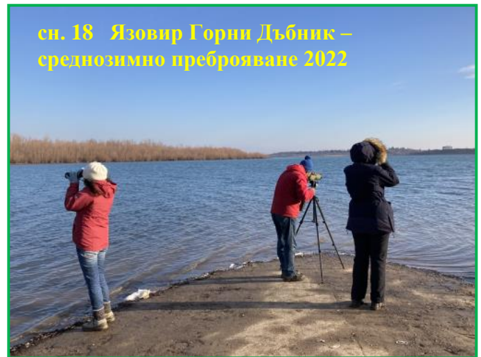
сн. 18 Язовир Горни Дъбник – среднозимно преброяване 2022

Александрово, рибарници, блата и др. Наблюдавани са екземпляри от различни видове водолюбиви птици като: тундров лебед, ням лебед, голям нирец, бял ангъч, зеленоглава патица, голям корморан, малък корморан, малък гмурец, голям гмурец, зимно бърне, лиска, голяма бяла чапла, сива чапла, черна качулата потапница, кафявоглава потапница, звънарка, сива патица, фиш, жълтокрака чайка, зеленоножка и др. Установени са и екземпляри от други видове птици: обикновен мишелов, белоопашат мишелов, полски блатар, малък ястреб, морски орел, голям синигер, син синигер, щиглец, кос, жълта овесарка, черешарка, гугутка, гривяк, посевна врана, сива врана, фазан, кълвачи, чинка, сива сврачка, земеродно рибарче, орехче, кукумявка и др. Събраните данни ще бъдат изпратени към Националната система за мониторинг на състоянието на биологичното разнообразие. Целта е установяване на числеността на зимуващите в България водолюбиви птици и определяне на най-важните водоеми и територии за тях. Събраната информация ще послужи и за анализ на промените в околната среда. В същия период са преброени птиците и в почти всички европейски страни и страните от Африка и Близкия Изток. Мониторингът на зимуващите водолюбиви птици се провежда в глобален мащаб от 1967 г., а в България - от 1976 г.