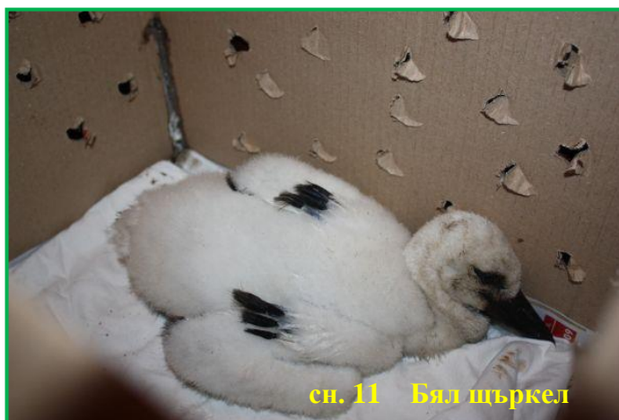
сн. 11 Бял щъркел