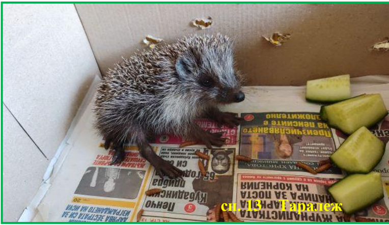
сн. 13 Таралеж