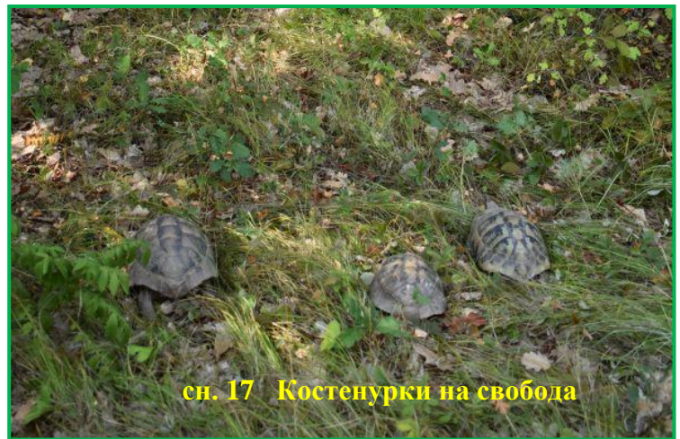
сн. 17 Костенурки на свобода

- изпратени в зоологически градини – гр. Ловеч и гр. Плевен, за лечение и отглеждане - 4 екземпляра от вида Бял щъркел от с. Йоглав, общ. Ловеч и 1 екземпляр от вида Бял щъркел от с. Садовец, общ. Долни Дъбник;