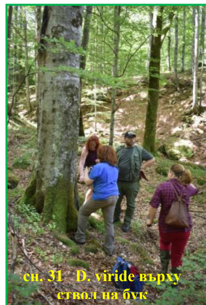
сн. 31 D. viride върху ствол на бук