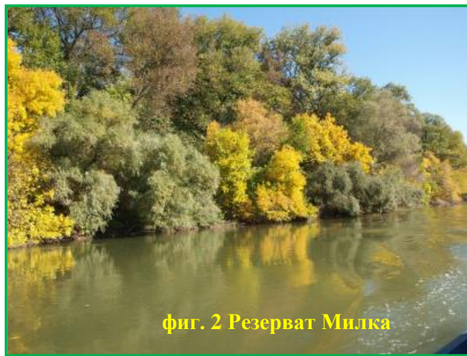
фиг. 2 Резерват Милка

По Закона за защитените територии (ЗЗТ) през 2022 г. са направени 47 бр. проверки.