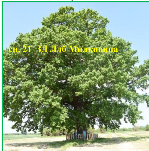
сн. 21 ЗД Лдб Милковица

През 2022 г. са проверени 12 бр. пунктове за събиране и изкупуване на охлюви в с. Ставерци и с. Гостиля, общ. Долна Митрополия; гр. Луковит; с. Радювене и гр. Ловеч, общ. Ловеч; гр. Угърчин, общ. Угърчин; гр. Искър, общ. Искър. Нарушения не са установени, с изключение при проверката в гр. Искър, която е по сигнал. При последната е установено, че изкупуването се извършва в необявен в РИОСВ – Плевен пункт, за което е съставен акт.