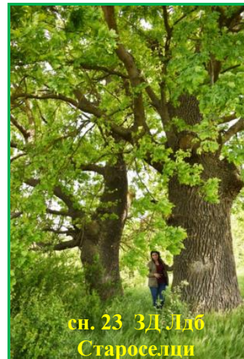
сн. 23 ЗД Лдб Староселци

Извършени са 22 бр. проверки на защитени дървета от видовете: Полски ясен в гр. Левски, Бяла топола, з-ще с. Българене, общ. Левски; Летен дъб (Сн. 21) в з-ще с. Милковица, общ. Гулянци, Летен дъб (Сн. 22 и 23) в з-ще с. Староселци, Бяла черница в с. Байкал и Бяла черница в с. Крушовене, общ. Д. Митрополия; Бяла черница в гр. Червен бряг, общ. Червен бряг; Летен дъб (3 екз.) в з-ще с. Коиловци, Гледичия и Черна топола в с. Горталово, общ. Плевен, Дива круша в з-ще гр. Пордим, общ. Пордим; Летен дъб, з-ще гр. Луковит, общ. Луковит; Космат дъб в з-ще с. Писарово, общ. Искър; Космат дъб в з-ще с. Владия, общ. Ловеч; на два екземпляра Обикновен бук, з-ще с. Бели Осъм, Явор (Сн. 24) и Планински ясен, в з-ще с. Черни Осъм, общ. Троян; Бяла топола на о-в „Персин“, з-ще гр. Белене и на 7 бр. Летен дъб, в гр. Белене, общ. Белене. При повече от проверките нарушения не са установени. Четири от тях са във връзка с предложения за обявяването на Космат дъб в з-ще с. Владия, Обикновен бук (Сн. 25), з-ще с. Бели Осъм, Явор и Планински ясен, з-ще с. Черни Осъм и 7 бр.