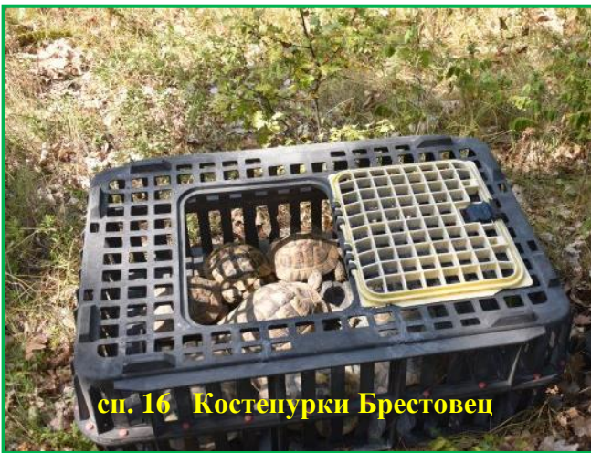
сн. 16 Костенурки Брестовец