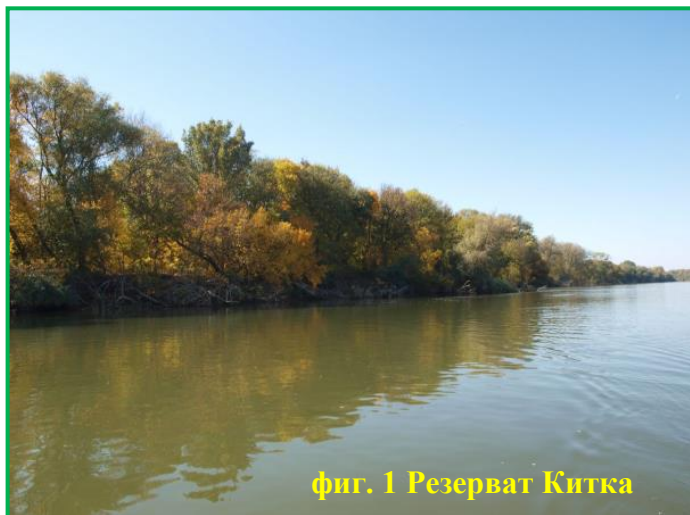
фиг. 1 Резерват Китка

Защитени територии в Плевенска област има в землищата на 43 населени места, а в Ловешка област - в землищата на 33 населени места.