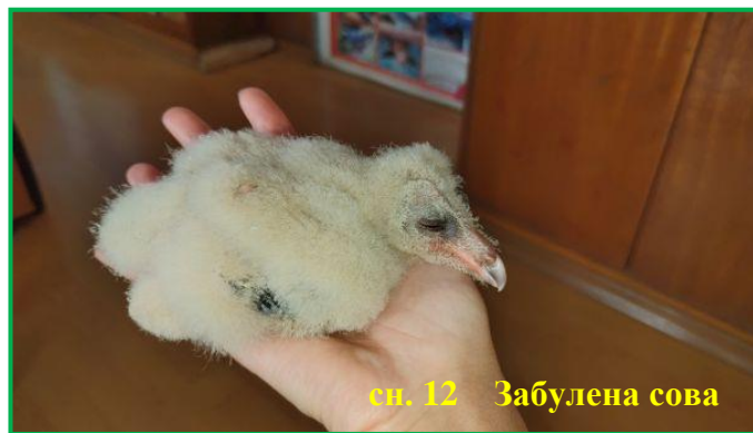
сн. 12 Забулена сова