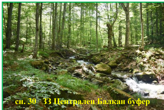
сн. 30 33 Централен Балкан буфер