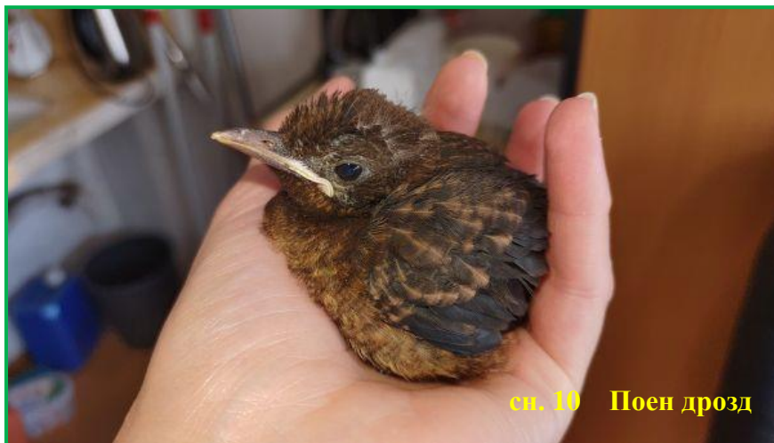
сн. 10 Поен дрозд