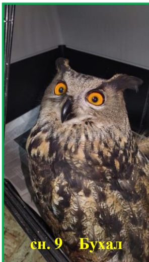
сн. 9 Бухал

Информацията за защитените територии в Плевенска и Ловешка област е достъпна на адрес: http://riew-pleven.eu/doc/BroshuraZT.doc