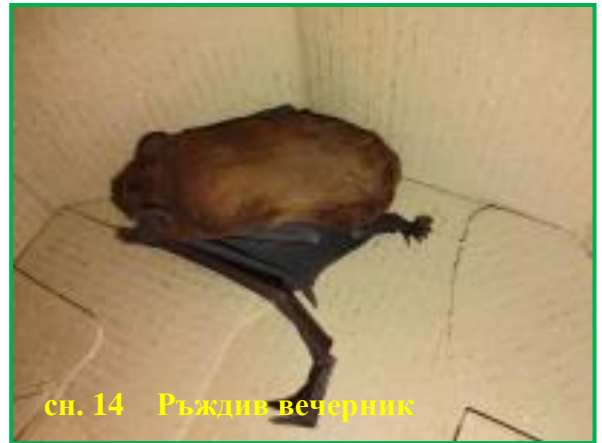
сн. 14 Ръждив вечерник

щъркел от гр. Искър, общ. Искър; с. Буковлък, общ. Плевен; с. Българене (общ. Левски), с. Староселци и с. Пещерна; 1 екземпляр от вида Таралеж (сн. 13) от гр. Левски, Голям ястреб от гр. Ловеч, общ. Ловеч, обл. Ловеч, 1 екземпляр от вида Ръждив вечерник (сн. 14) от гр. Плевен, общ. Плевен; 1 екземпляр от вида Малък ястреб и 1 екземпляр от вида Обикновен мишелов (Сн. 15) от гр. Плевен;