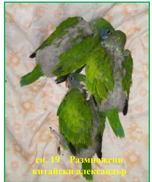
сн. 19 Размножени китайски александър

Извършена е проверка на Общински пазар - гр. Тетевен, относно търговия със защитени видове от Приложение №3 на ЗБР; нарушения не са установени.